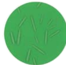
乳酸菌 Image = 80 μm

腸の中で活発な働きをする細菌が、食べ物を分解する手助けをすることによって、消化プロセスを助けることができます。乳酸発酵食品が提供する健康上の効用を得るためには、生きた活性細菌を定期的に摂取する必要があります。これら細菌細胞の体内での寿命は3日から10日だと考えられているからです。健康上の効用を生み出すのは、胃の中の酸性状態と腸内のアルカリ性に耐えられる生きた細菌だけなのです。